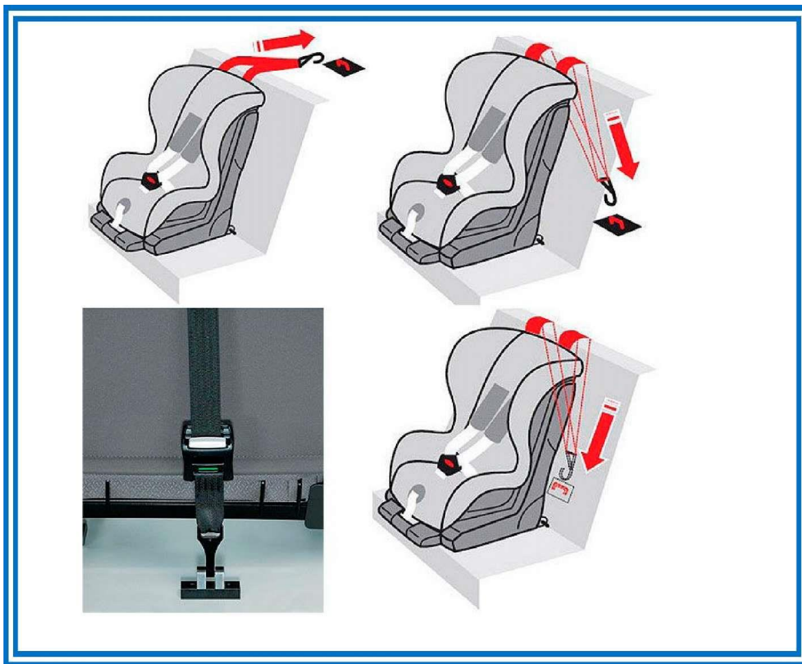
Рисунок 7. Способы фиксации якорного крепления

После того, как автокресло установлено, необходимо учесть ряд условий при усаживании в него ребенка.