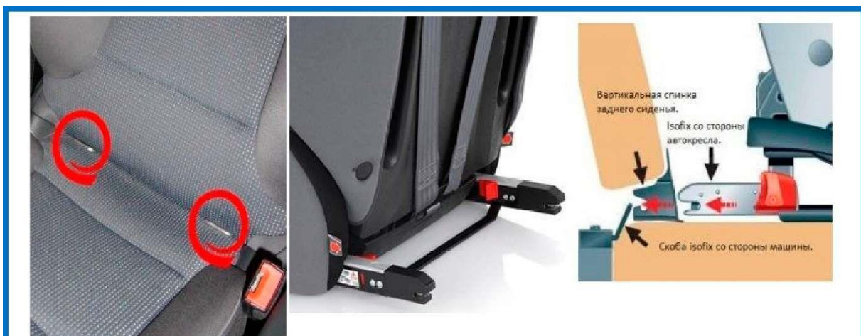
Ответные петли isofix в машине./ Isofix сзади детского автокресла./ Схема в разрезе.

Детское автокресло с ISOFIX предполагает наличие двух жестких