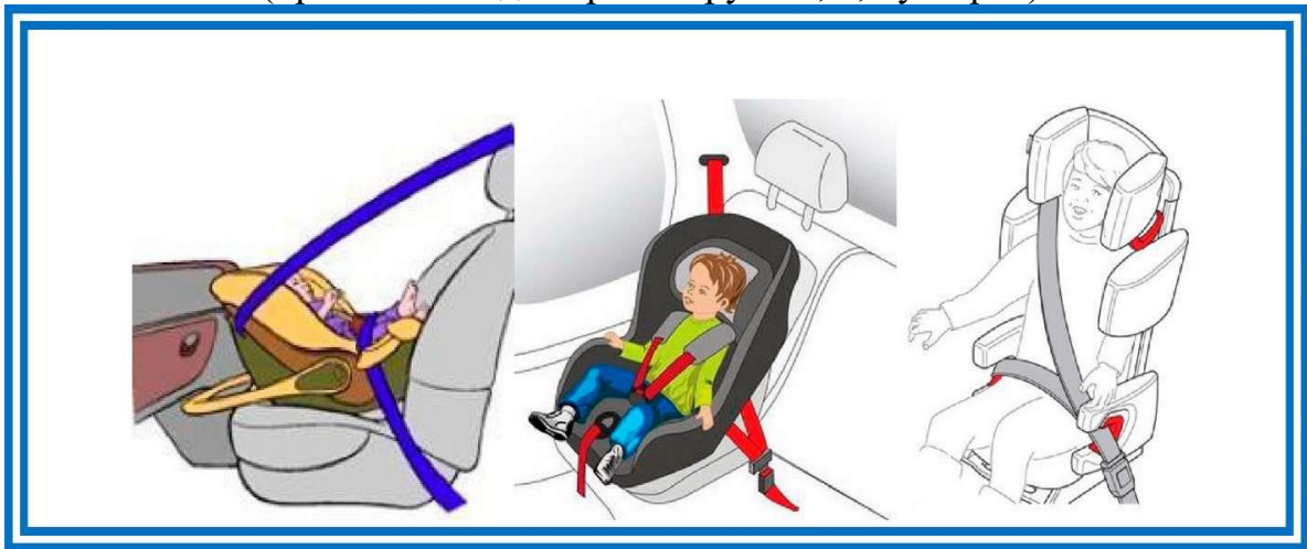
Рисунок 4. Крепление штатными ремнями безопасности