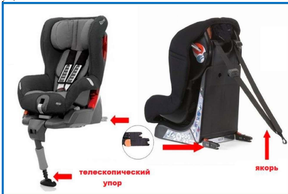
Рисунок 6. Телескопический упор и якорное крепление

Телескопический упор и якорное крепление разработаны специально для того, чтобы в момент столкновения снизить нагрузку на основное крепление детского автокресла, избежать возможности «клюющего» движения при лобовом столкновении и этим обеспечить более высокую безопасность в аварийных ситуациях.