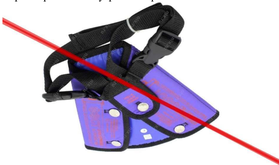
Адаптеры использовать категорически запрещается Рисунок 2. Внешний вид адаптера

Кроме представленных детских удерживающих устройств в магазинах еще продаются адаптеры как фирмы «ФЭСТ», так и других фирм. Госавтоинспекция выступает категорически против их применения, так как при ДТП адаптер оказывает слишком высокие нагрузки на брюшную полость ребенка, практически врезается в нее, что приводит к травмированию внутренних органов.